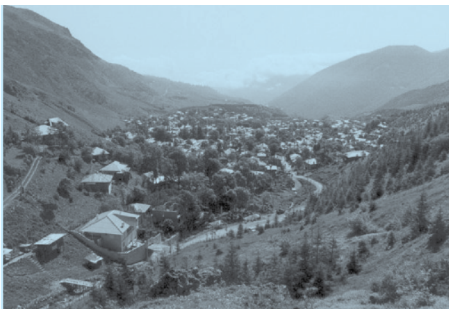
تصویر ۳: روستای جواهرده، تابستان ۱۳۹۰

سماموس) و ازک، سه براره رژه (رجه). مرتفع‌ترین این قله‌ها، قلّه سرخ‌تله است. لپاسر با چشمه‌های معروف و درمانی آن و سماموس و مقبره شاه‌یحیی